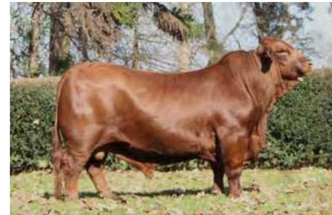
LUQUENSE 153 “CAMBIAZO”