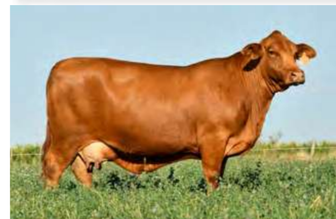
LUQUENSE 036 “REINA”