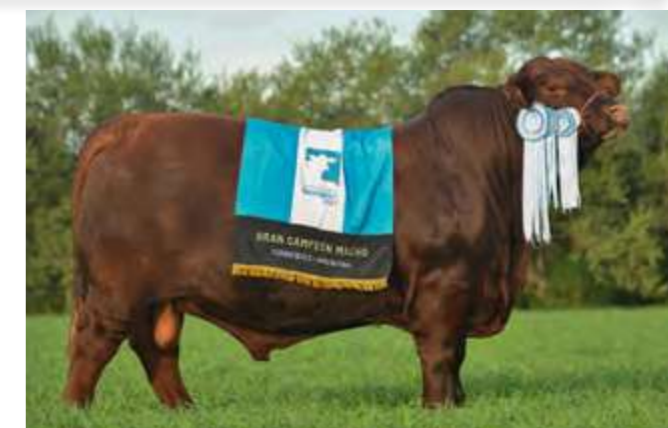
LUQUENSE 467 “MUNDIAL”