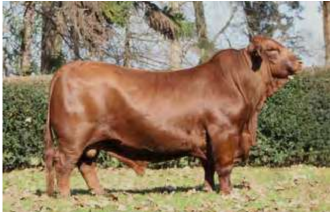
LUQUENSE 153 “CAMBIAZO”