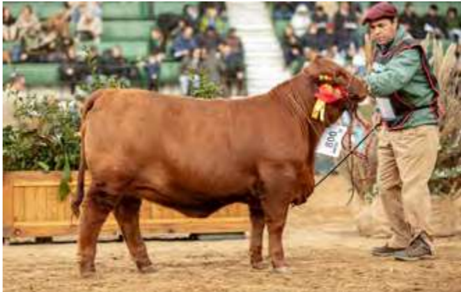
3er TERNERA INTERMEDIA