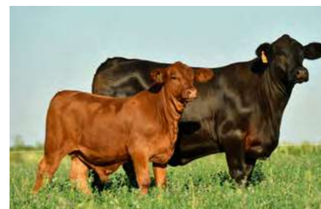
LUQUENSE 306 “GENIA”