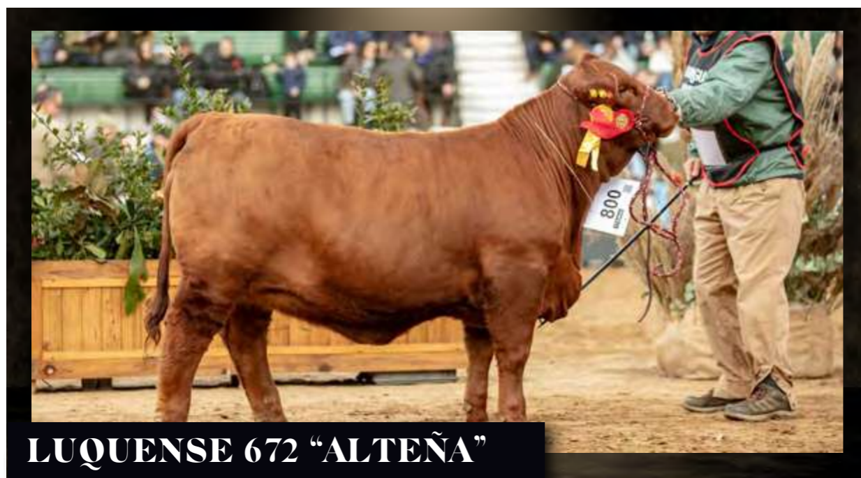
LUQUENSE 672 "ALTEÑA"