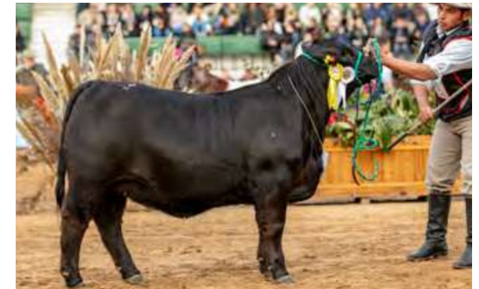
3er MEJOR TER. MENOR