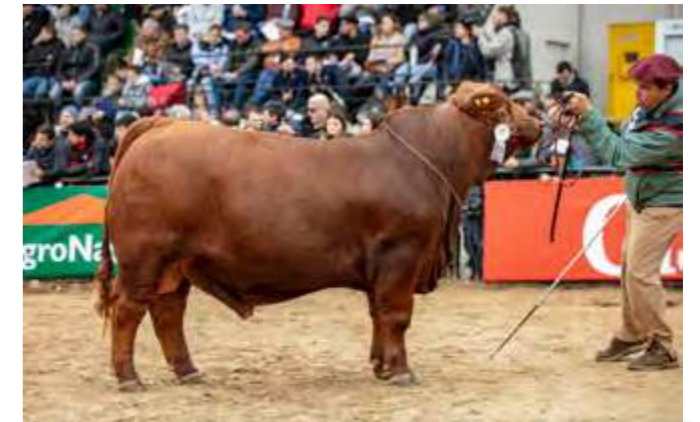
LUQUENSE 573 “TEQUILA”