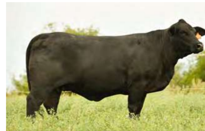
LUQUENSE 240 “MOROCHA”