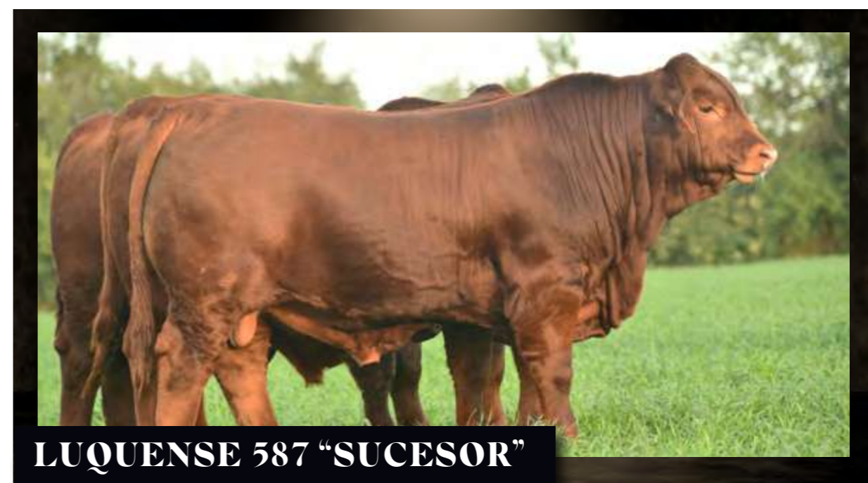
LUQUENSE 587 "SUCESOR"