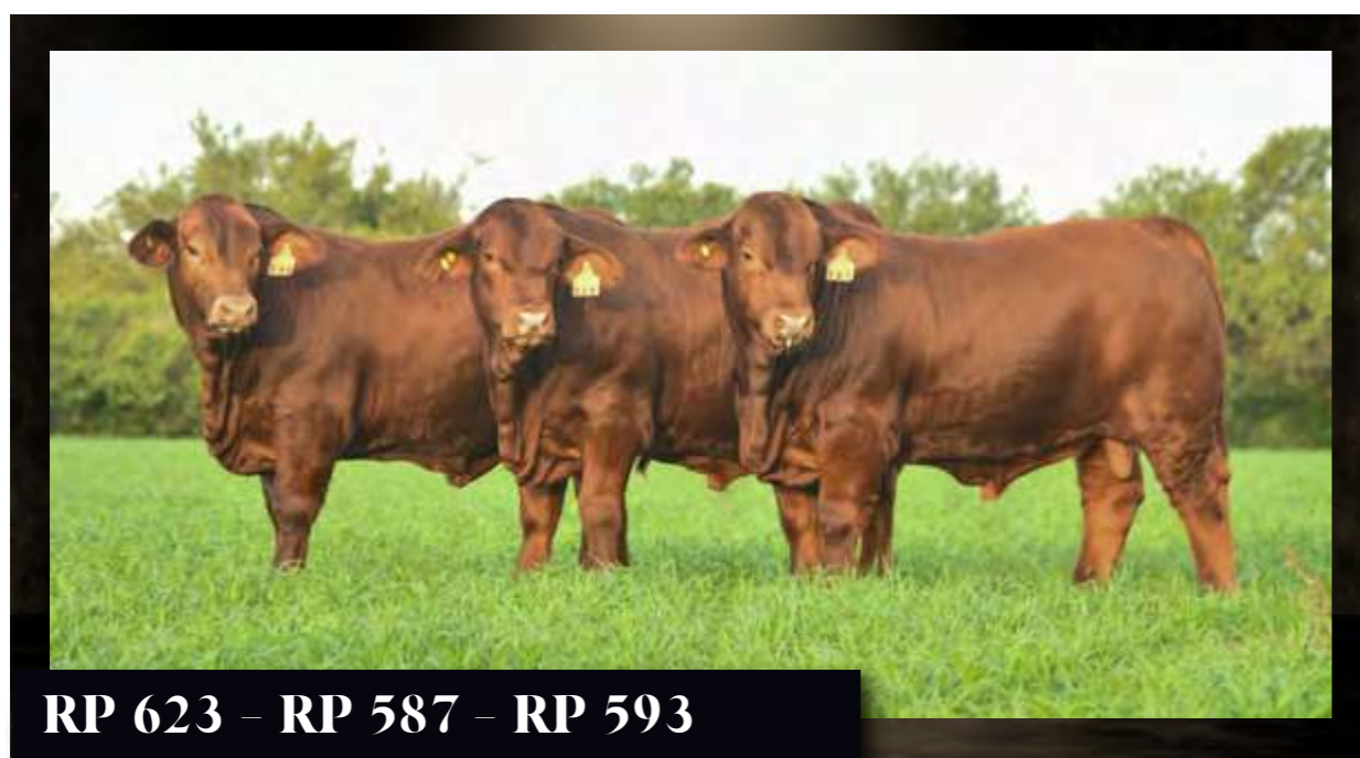
RP 623 - RP 587 - RP 593