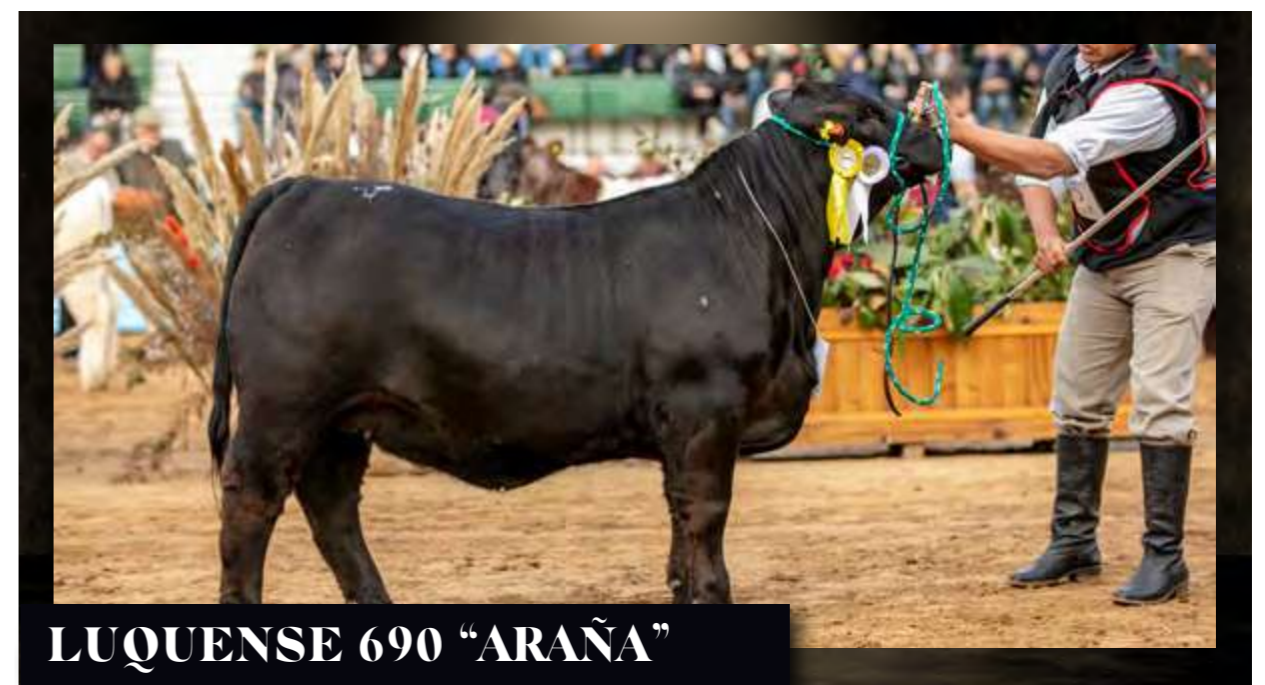
LUQUENSE 690 "ARAÑA"