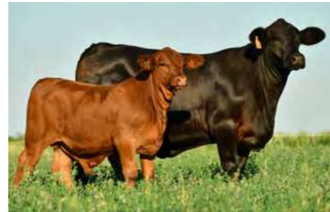
LUQUENSE 306 “GENIA”