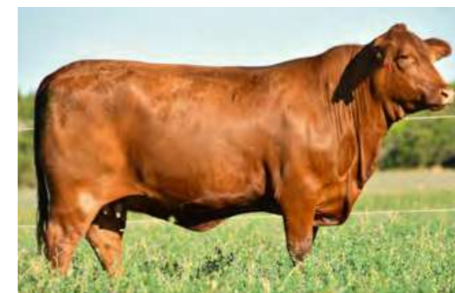
LUQUENSE 290 “DESATADA”