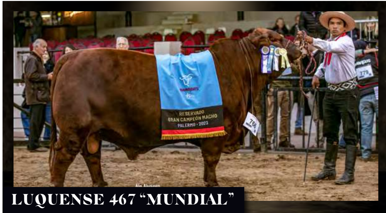
LUQUENSE 467 "MUNDIAL"