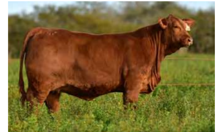
LUQUENSE 420 “PRODIGA”