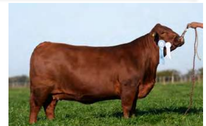
LUQUENSE 316 “CUARTETERA”