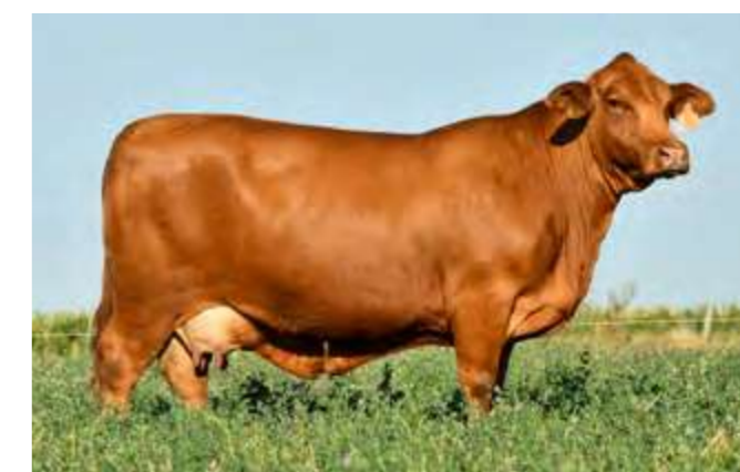
LUQUENSE 036 “REINA”