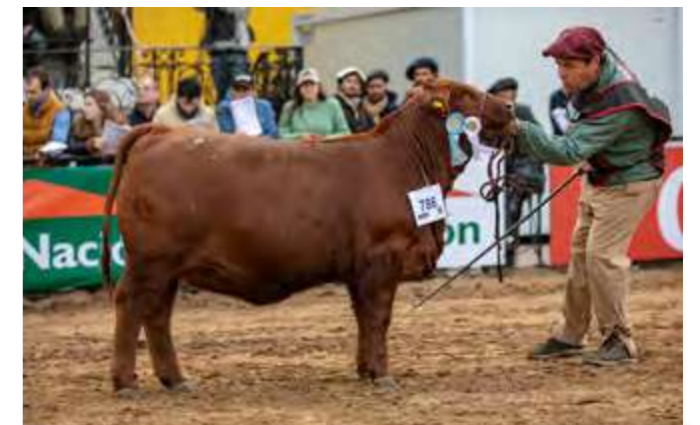
CAMPEÓN TERNERA MENOR