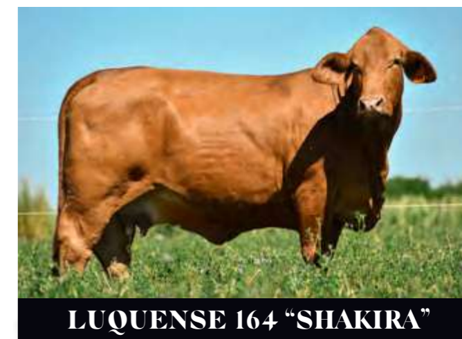
LUQUENSE 164 “SHAKIRA”