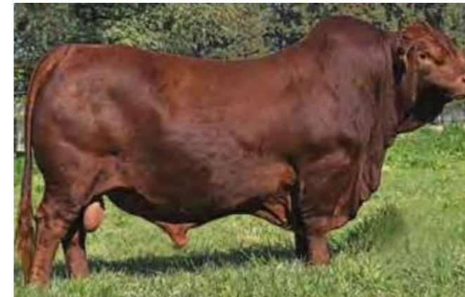
LUQUENSE 013 “YAGUARETE”

“VIAMONTE” LATISANA BRG 16 HEMINGWAY T/E