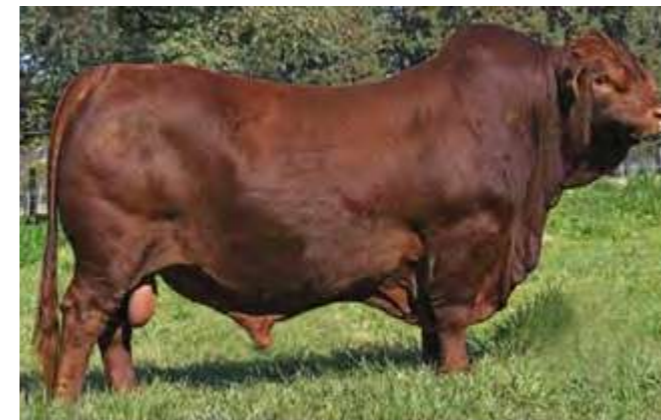
LUQUENSE 013 “YAGUARETE”