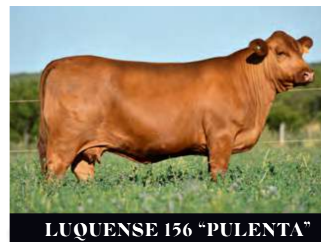
LUQUENSE 156 “PULENTA”