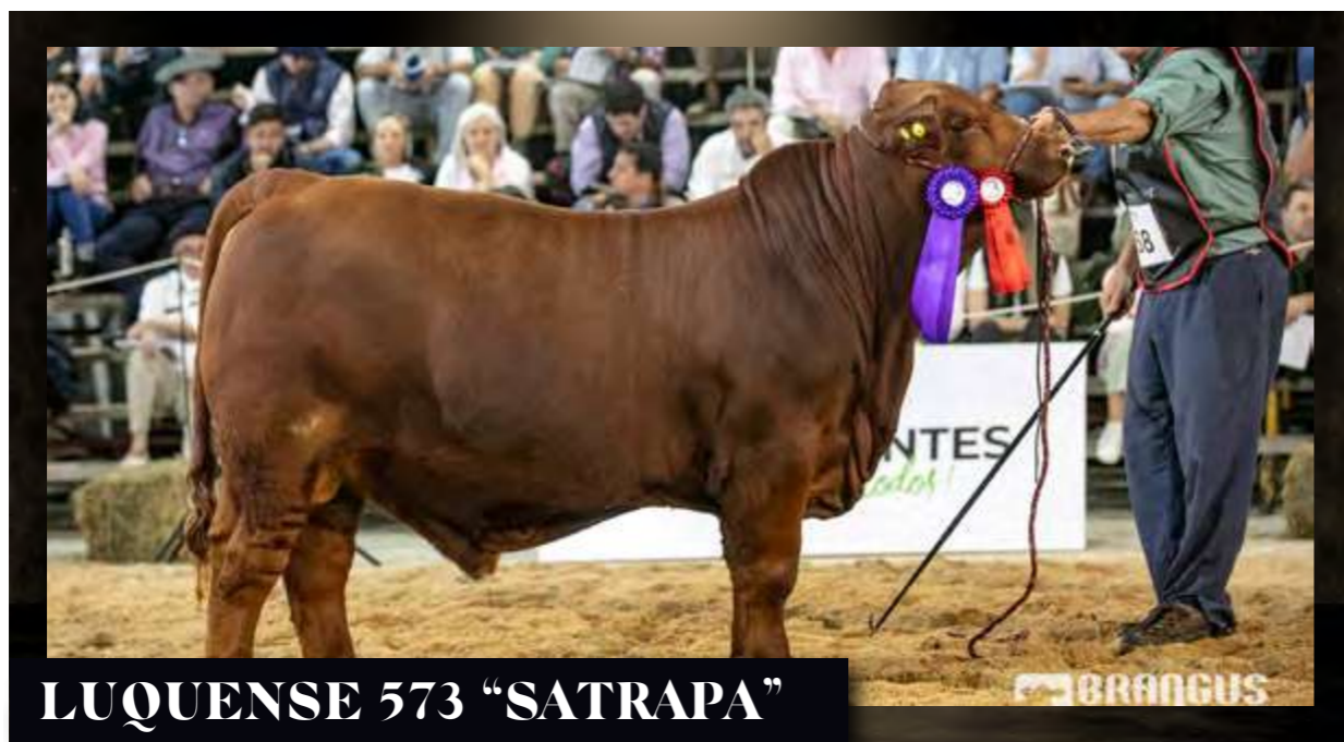
LUQUENSE 573 "SATRAPA"