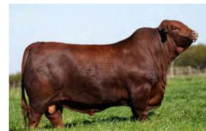
LUQUENSE 299 “TOSTADO”