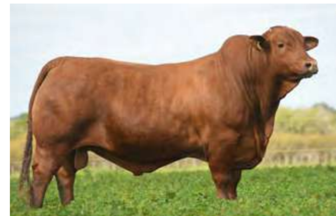
LUQUENSE 303 “CHONGO”