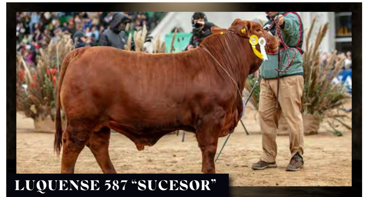
LUQUENSE 587 "SUCESOR"