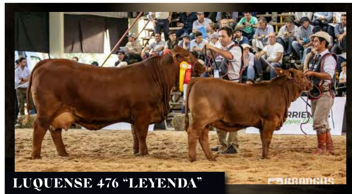
LUQUENSE 476 "LEYENDA"