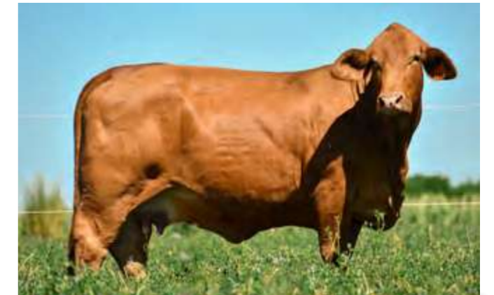
LUQUENSE 164 “SHAKIRA”