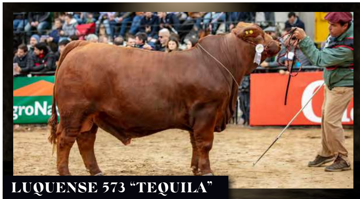
LUQUENSE 573 "TEQUILA"