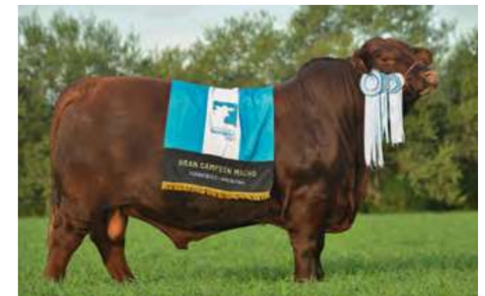
LUQUENSE 467 “MUNDIAL”