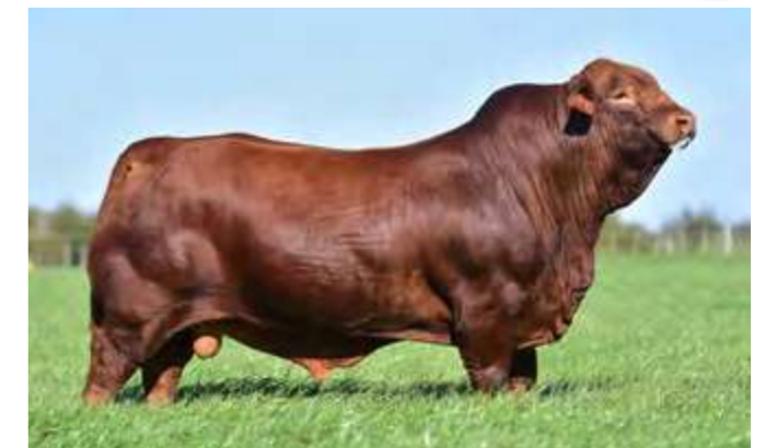
LUQUENSE 361 “ALCATRAZ”