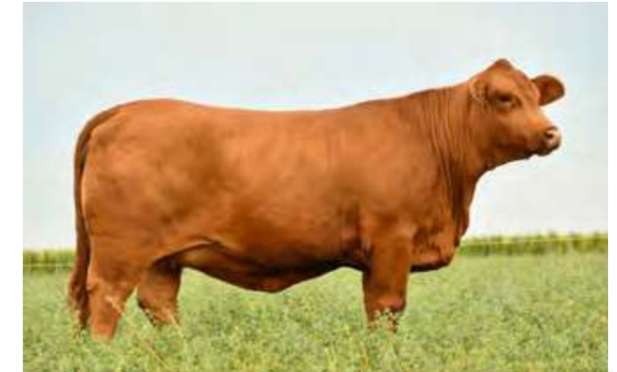
LUQUENSE 240 “COQUETA”