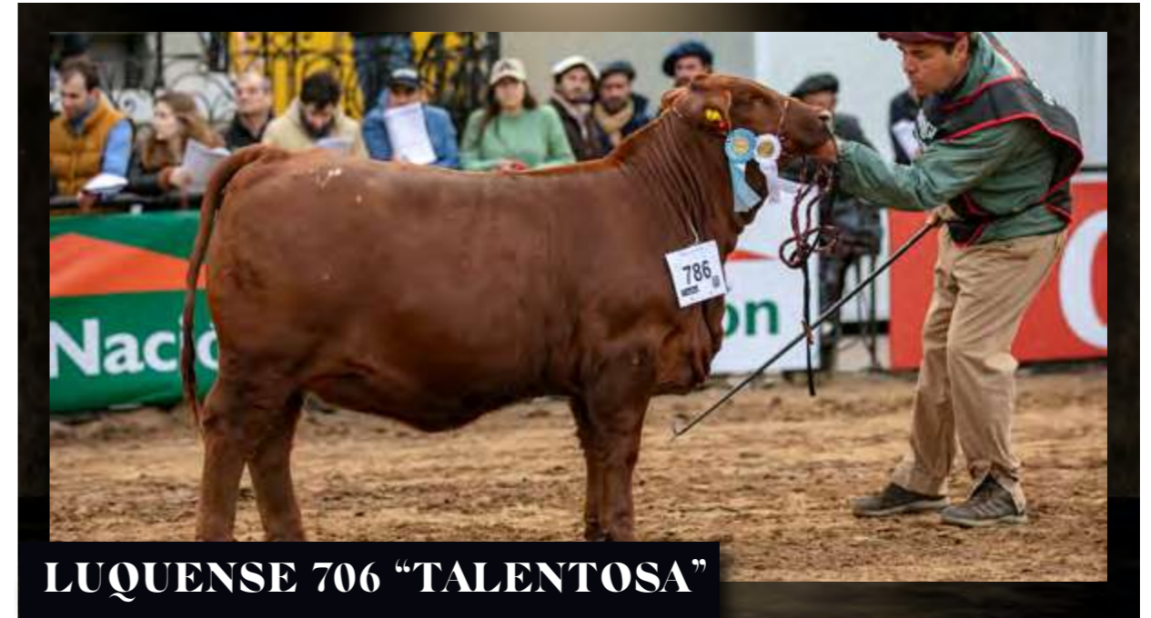
LUQUENSE 706 "TALENTOSA"