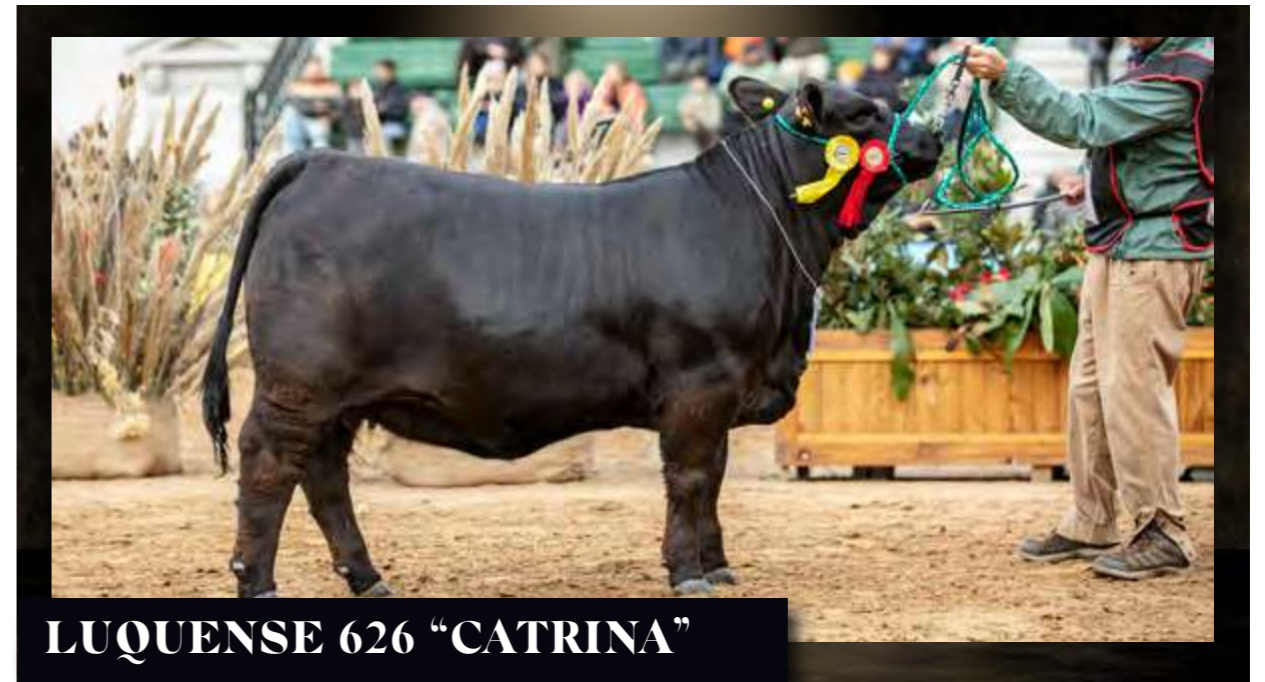
LUQUENSE 626 "CATRINA"