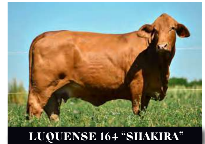
LUQUENSE 164 “SHAKIRA”