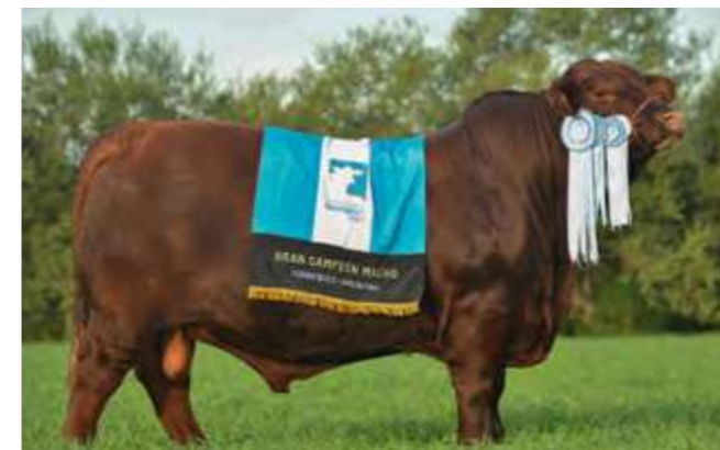
LUQUENSE 467 “MUNDIAL”