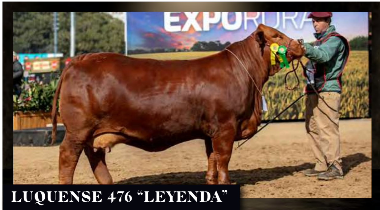
LUQUENSE 476 "LEYENDA"