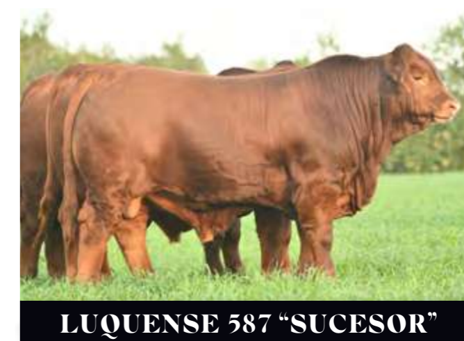
LUQUENSE 587 “SUCESOR”