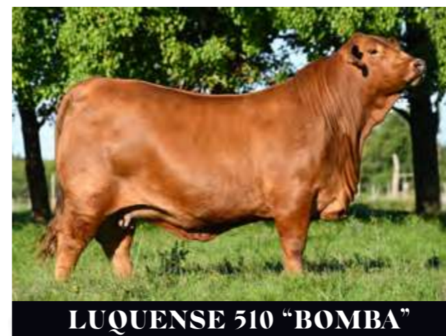
LUQUENSE 510 “BOMBA”