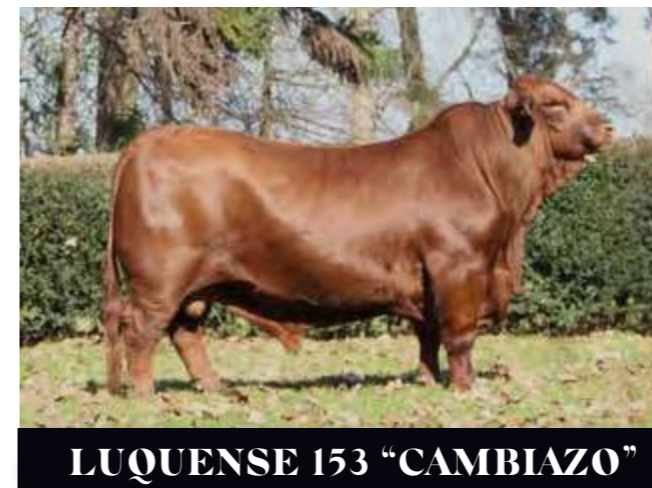
LUQUENSE 153 “CAMBIAZO”

Padre: “CAMBIAZO” LUQUENSE 153 CAMBIAZO T/E Madre: “SHAKIRA” LUQUENSE 164 MALAMBO 2718 T/E Abuelo Materno: “MALAMBO” TRES CRUCES HOUSTON 8206